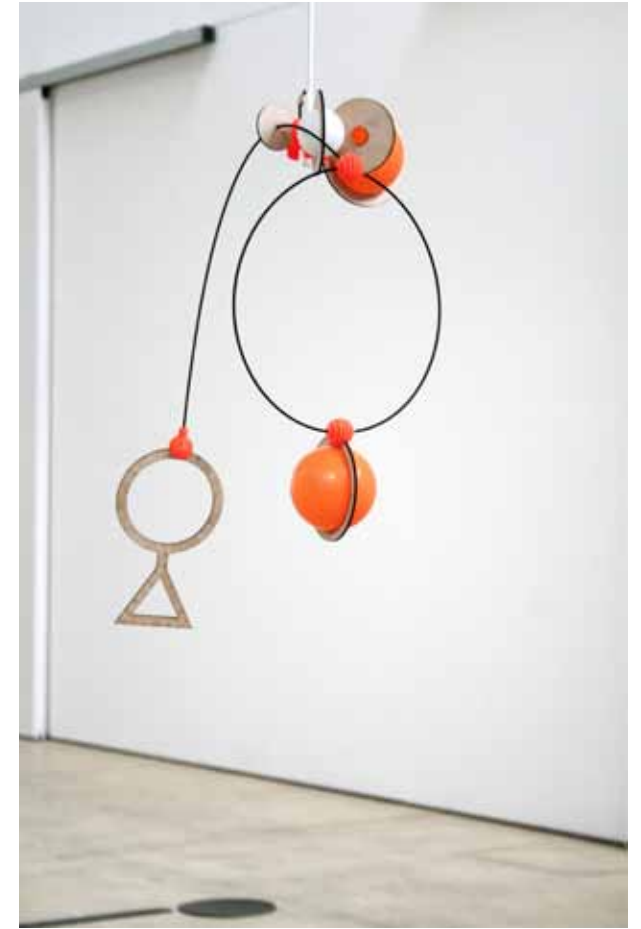
Detailansichten (2015) Hochschule der Künste Bern, Bern