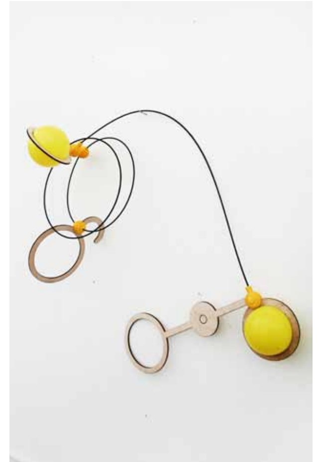
Detailansichten (2015) Hochschule der Künste Bern, Bern