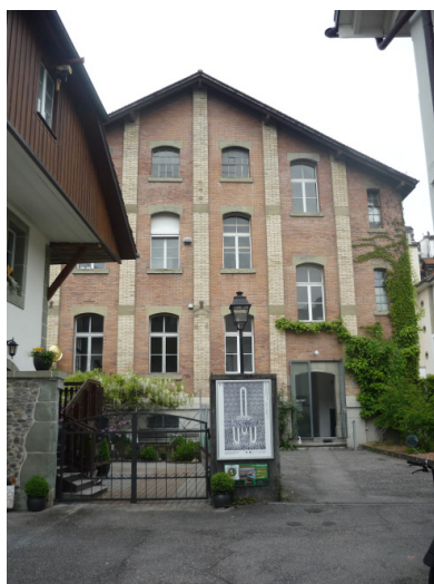
Centre Fri-Art, Image Emilie Lopes Garcia, tous droits réservés

La promenade audio introduit les questions liées à la déambulation et au chemin. Thématiques qui peuvent être mises en relation avec l'art (se perdre, trouver ses repères, les déplacements, la diversité des points de vue, l'incertitude, etc.) Entre ces différentes réflexions, l'auditeur/promeneur entend des anecdotes quotidiennes artistiques liées au chemin, des descriptions, ou juste les bruits ambiants. La voix s'adresse à lui de manière directe. Le futur visiteur est ainsi mis dans une position active et réflexive qui lui permettra d'aborder l'exposition avec son propre bagage.