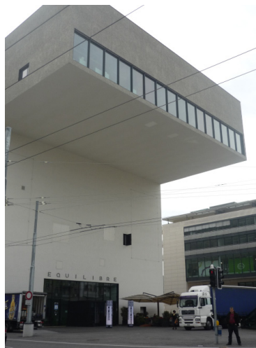
Equilibre, Image Emilie Lopes Garcia, tous droits réservés

L'auditeur/promeneur devient alors visiteur de l'exposition.