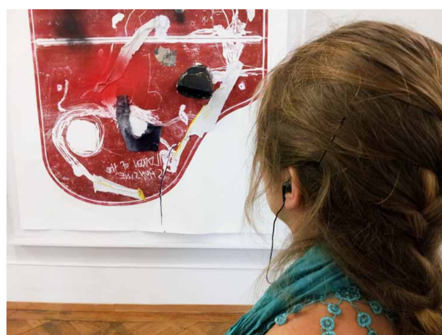
Image du haut: Les participants du Workshop enregistrent leurs interventions